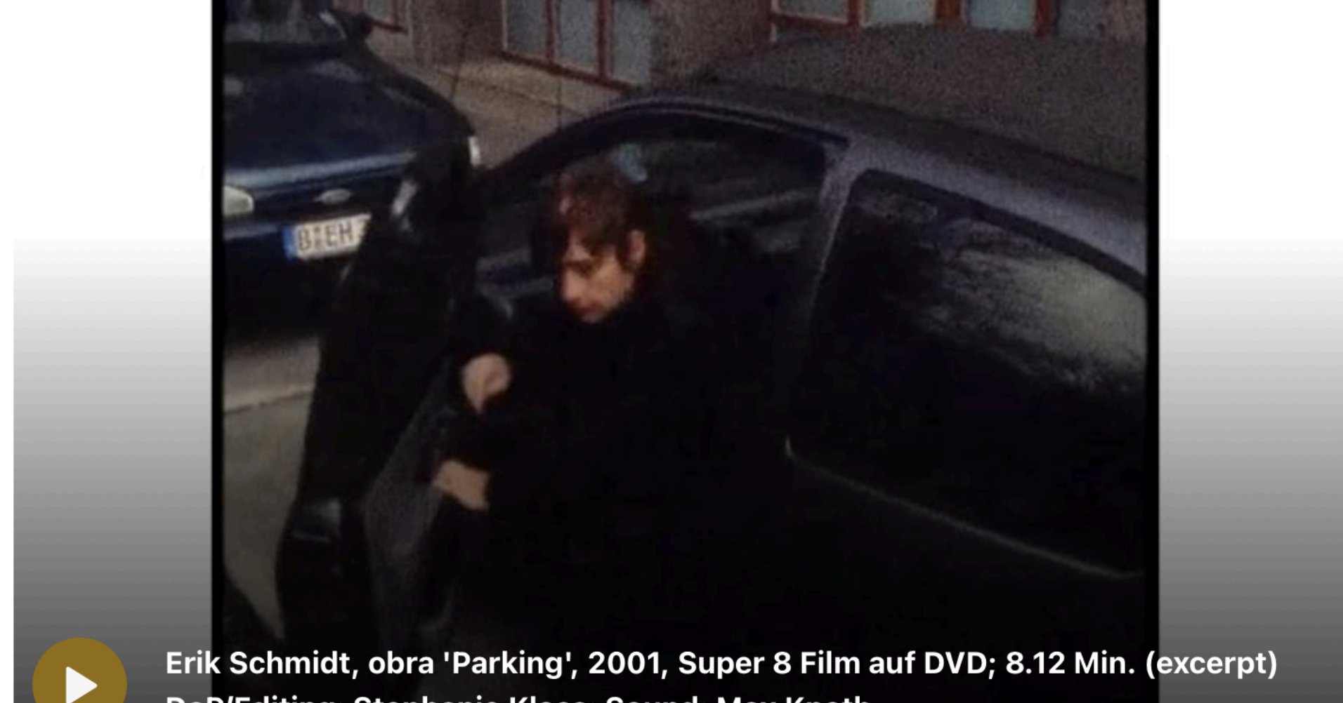
Erik Schmidt, obra 'Parking', 2001, Super 8 Film auf DVD; 8.12 Min. (excerpt) DoP/Editing: Stephanie Kloss; Sound: Max Knoth

En sus primeras pinturas, la ciudad aparece casi como un decorado fotográfico: coches, edificios, hombres trajeados, escenas aparentemente neutras. Pero basta detenerse un poco más para que algo empiece a parpadear. La pincelada fragmentada, la materia pictórica, el encuadre forzado rompen cualquier ilusión de transparencia.