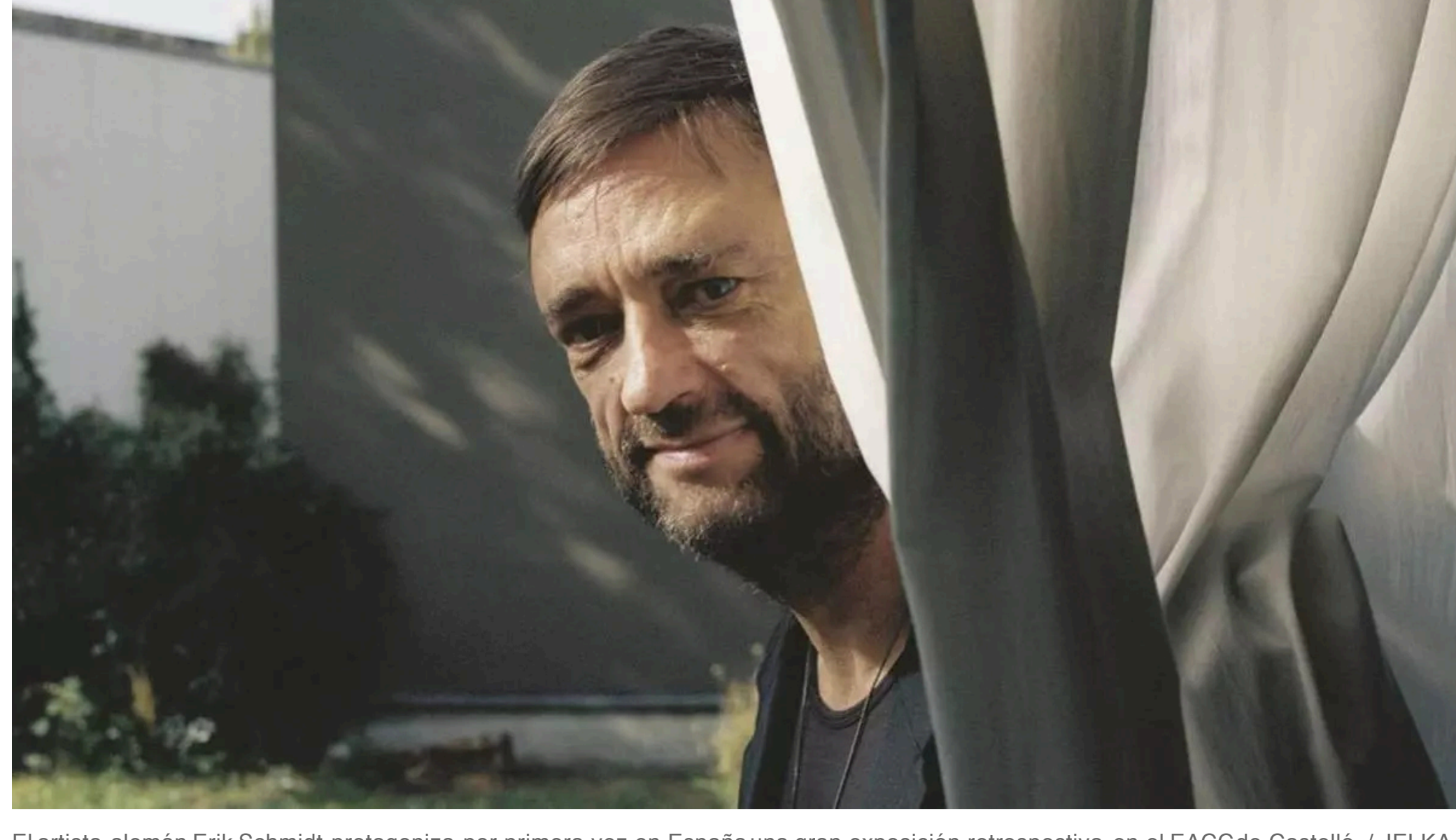
El artista alemán Erik Schmidt protagoniza por primera vez en España una gran exposición retrospectiva en el EACC de Castelló.

La muestra 'The Rise and Fall of Erik Schmidt' del artista alemán se inaugura el 27 de febrero en el Espai d'Art Contemporani de Castelló (EACC)